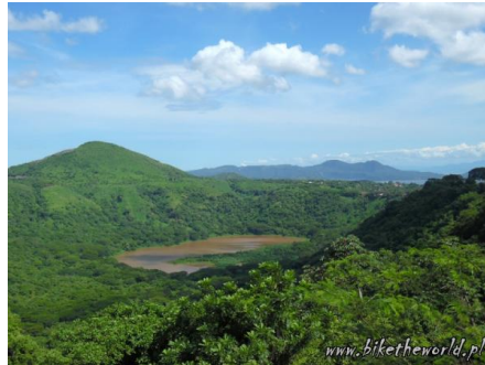
[4]01 Szlakiem wulkanów. Kliknij obrazek aby powiększyć